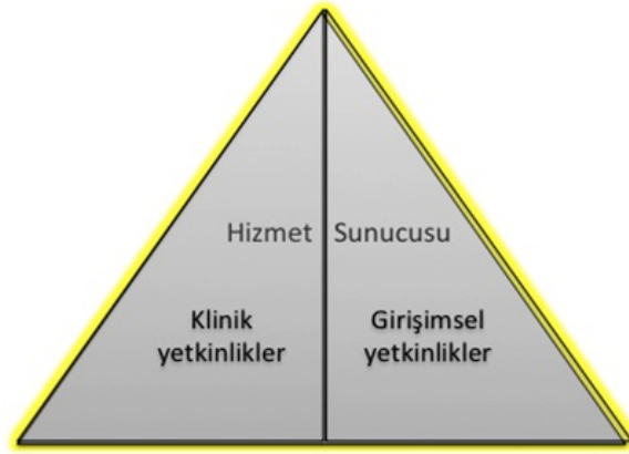
Şekil 2- TUKMOS yedinci temel yetkinlik alanı: Hizmet Sunucusu

Girişimsel Yetkinlik: Bilgiyi, kişisel, sosyal ve/veya metodolojik becerileri tıbbi girişimler konusunda kullanabilme yeteneğidir.