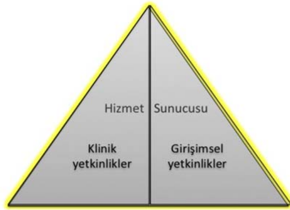
Şekil 2- TUKMOS yedinci temel yetkinlik alanı: Hizmet Sunucusu

Girişimsel Yetkinlik: Bilgiyi, kişisel, sosyal ve/veya metodolojik becerileri tıbbi girişimler konusunda kullanabilme yeteneğidir.